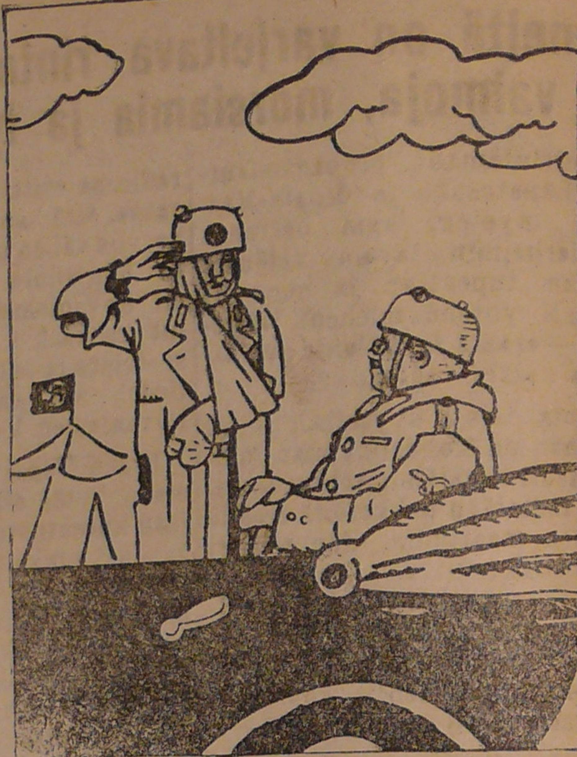
TOTUUS ENNEN KAIKKEA

„Kansamme on päättänyt, että hitleriläisen vaara, joka uhkaa kaikkea sitä, mitä me puolustamme, on hävitettävä ja kansamme pysyy yhä lujemmin tässä päätöksessään. Me olemme noudattaneet ja noudattamme edelleenkin kaikinpuolisen avunannon politiikkaa niille maille, jotka tekevät toimekasta vastarintaa hyökkääjävallalle. Tämä politiikka on terveen järjen politiikka. Mutta se on vain menettelytapa eikä päämäärä. Meidän todellinen ja tinkimätön päämäärämme on hitleriläisen vaaran hävittäminen. Tämän päämäärän saavuttamisessa me jaamme täydellisesti vastuun niiden kansojen kanssa, jotka tämän päämäärän saavuttamiseksi taistelevat ja vertaan vuodattavat“.